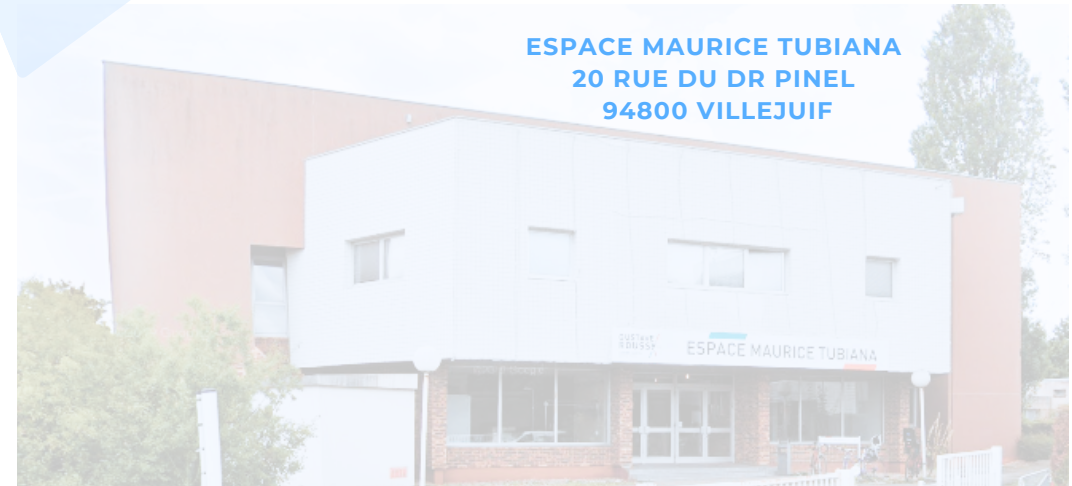
ESPACE MAURICE TUBIANA 20 RUE DU DR PINEL 94800 VILLEJUIF