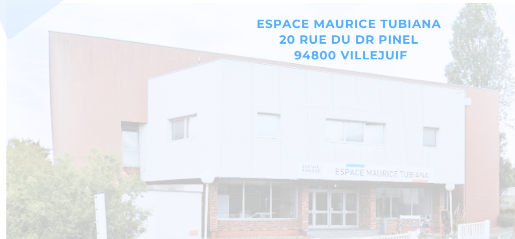
ESPACE MAURICE TUBIANA 20 RUE DU DR PINEL 94800 VILLEJUIF